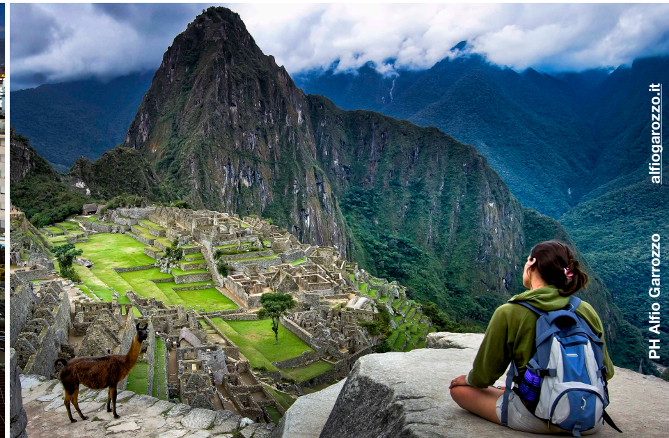
alfiogarozzo.it PH Alfio Garrozzo

Università LUMSA Palermo, Via Filippo Parlatore, 65 - 25-26-27- MAGGIO 2018